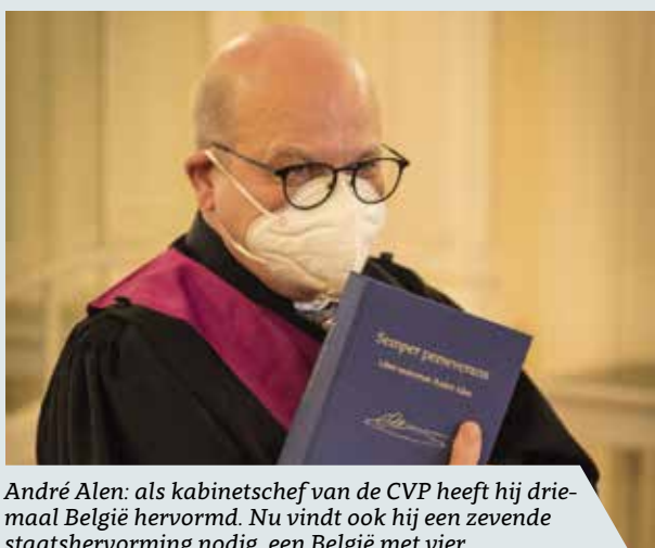
André Alen: als kabinetschef van de CVP heeft hij driemaal België hervormd. Nu vindt ook hij een zevende staatshervorming nodig, een België met vier.

Statistiek Vlaanderen, de studiedienst van de Vlaamse regering, schrijft hierover het volgende: "In 2019 bedroeg de bijdrage van de Vlaamse overheid aan de totale geconsolideerde bruto schuld van alle Belgische overheden, (volgens het INR-concept) bijna 18,6 miljard euro. De schuld van de Waalse overheden (Franse Gemeenschap en Waals Gewest) lag op ruim 31 miljard euro, de schuld van het Brusselse Hoofdstedelijke Gewest op 5,5 miljard euro en de schuld van de overige regionale en interregionale overheidsinstanties bedroeg bijna 5,8 miljard euro." Jawel, u hebt goed gelezen. Aan Vlaamse kant hebben gewest en gemeenschap (samen de VG) een schuld van 18,6 miljard euro.